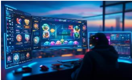
블록체인 게임 (P2E)

Flagship Game인 MotorCity와 같은 자체 NFT 게임 출시 및 외부 게임 온보딩을 통해 플레이어를 유입시키고, GameFi Token Economy를 통해 유저들의 후원과 투자를 바탕으로 개발 자금을 확보하며, 유저 맞춤형 게임을 양산합니다.